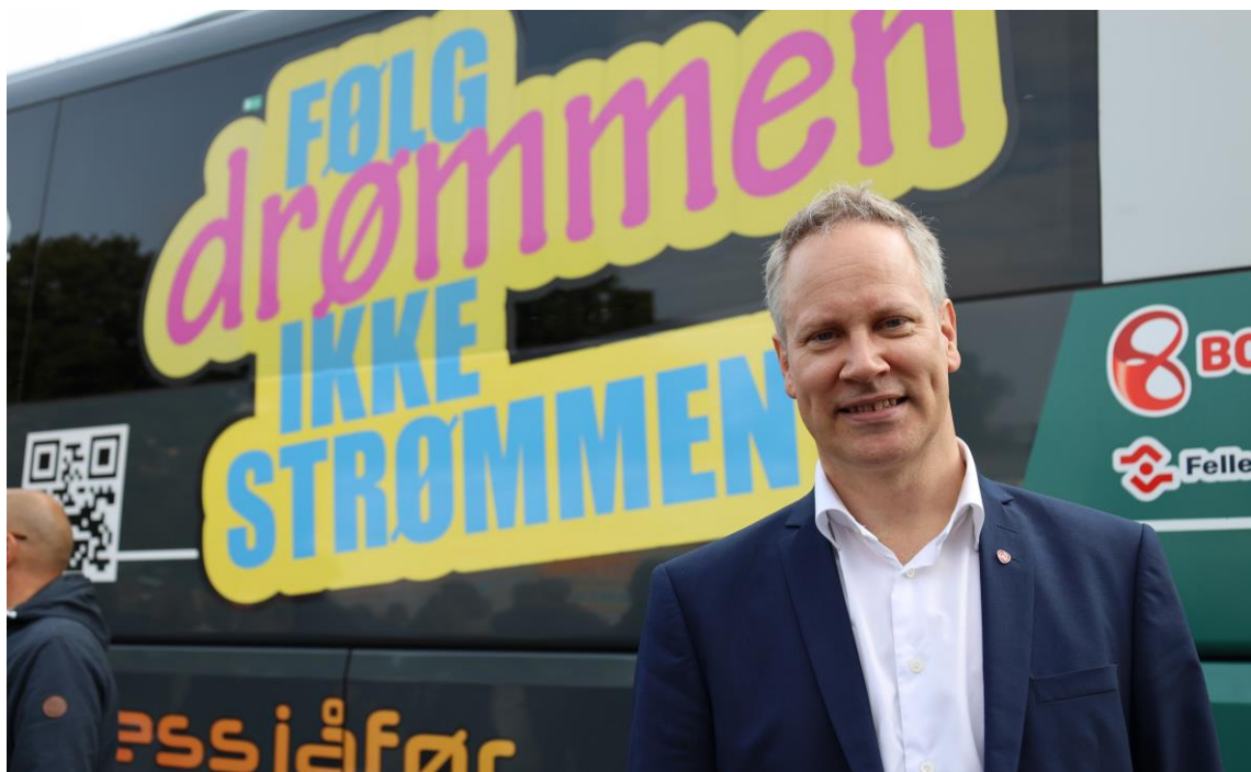
ÅPNET REKRUTTERINGSTURNÉEN: Samferdselsminister, Jon Ivar Nygård, var på plass da «Følg drømmen ikke strømmen» turnéen ble sparket i gang på onsdag.

- Denne gangen blir ikke veiprosjektene satt på vent