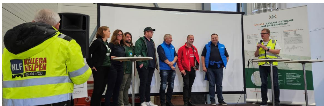
Fylkesordfører-kandidater på scenen