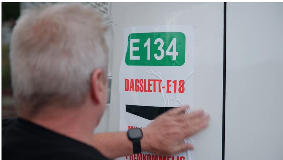
Lastebilene ble dekorert med bannere og klistemerker