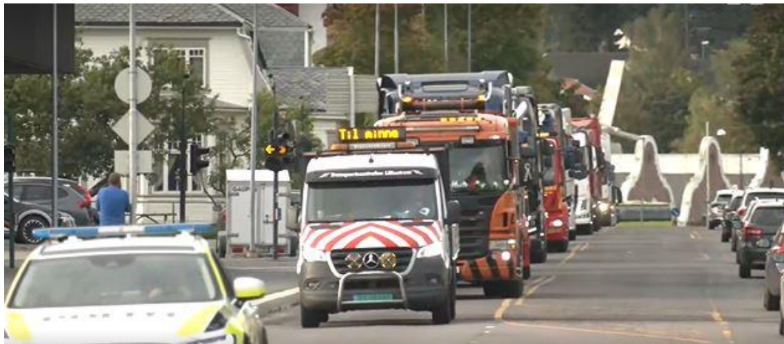
Fra minnekortesjen gjennom Hønefoss

- Denne gangen blir ikke veiprosjektene satt på vent