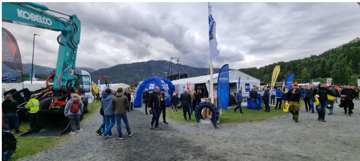
Fra fjorårets NLF stand på Dyrsku'n