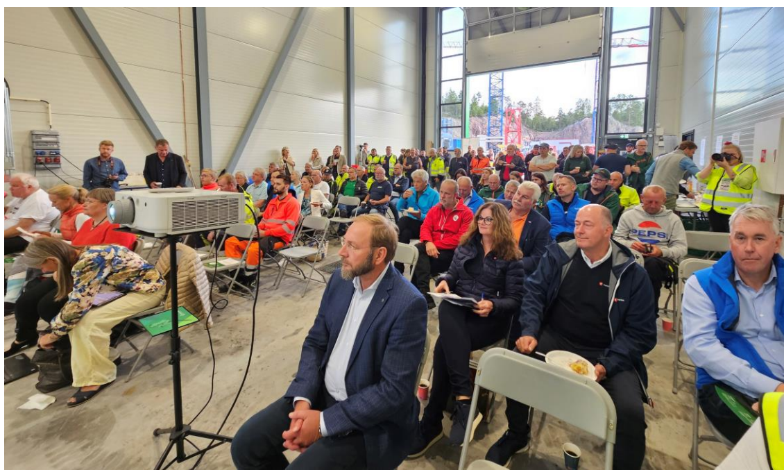
Næringslivsfolk og politikere samlet i Røyken Næringspark