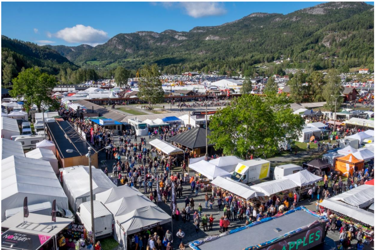
Velkommen til NLF sin stand på Dyrsku'n 2023