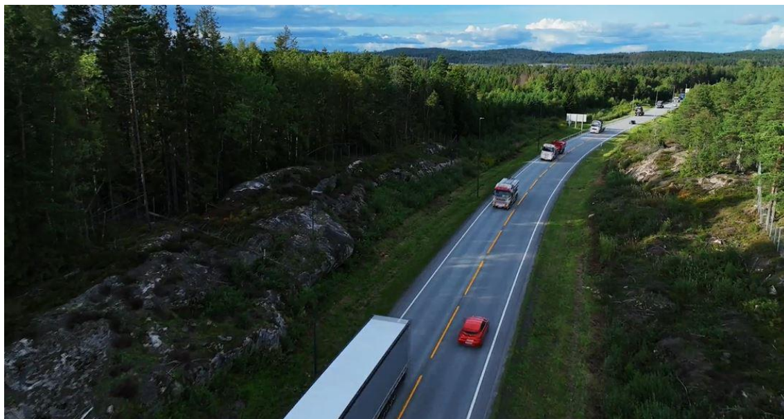
Lastebiler kom inn fra alle kanter