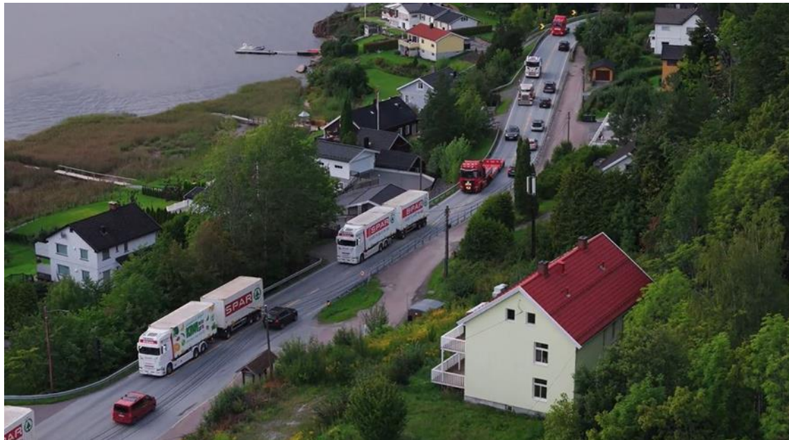
Demonstrasjonskonvoien gjennom 40 sonen i Lahell.

En rekke toneavgivende politikere var med i konvoien – både rikspolitikere, fylkesordfører-kandidater og ordfører-kandidater fra flere partier. Dagen før aksjonen slapp nyheten om bevilgning til Oslofjordforbindelsen ut, og omtrent samtidig med aksjonen startet kom meldingen om startbevilgning til Røldalstunnelen. Dermed begynner en del viktige brikker for videre utvikling av E134 komme på plass. Dagslett, døgnhvileplasser og Saggrenda – Elgsjø er blant prosjektene som gjenstår.