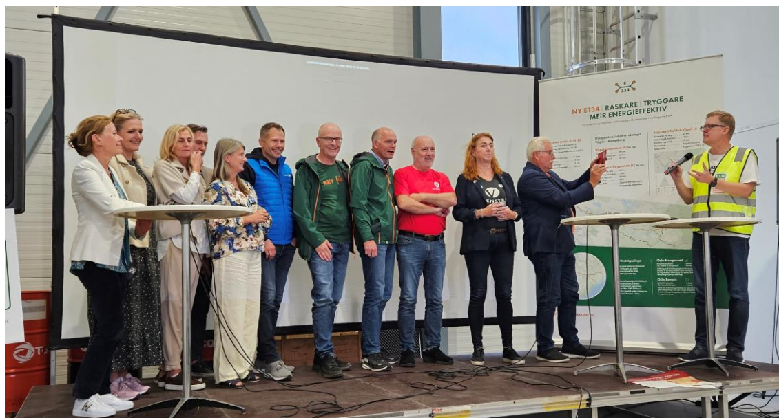
Lokale ordfører- og toppkandidater fra kommunene i Oslofjordområdet som trenger bedre veier